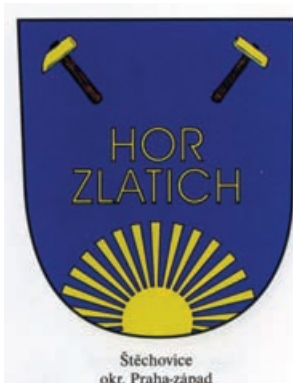
Obr.46 Štěchovice okr. Praha-západ