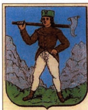
Obr.42 Bruntál - 1885 - švancara