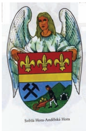
Obr.33 Andělská hora - kamenný portál