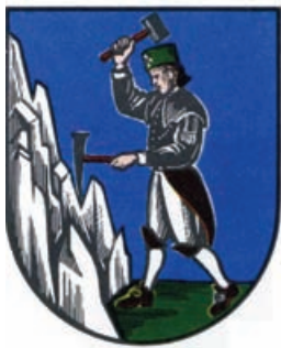
Obr.22 Stříbrná Skalice