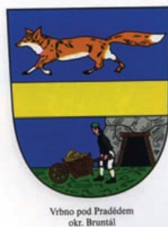
Obr.31 Vrbno p.P.