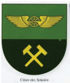
Obr.49 Citice okr. Sokolov