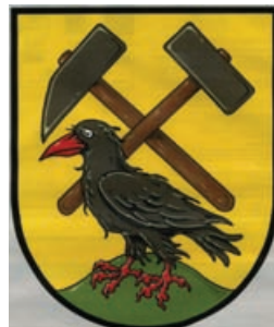
Obr.3 Horní Město