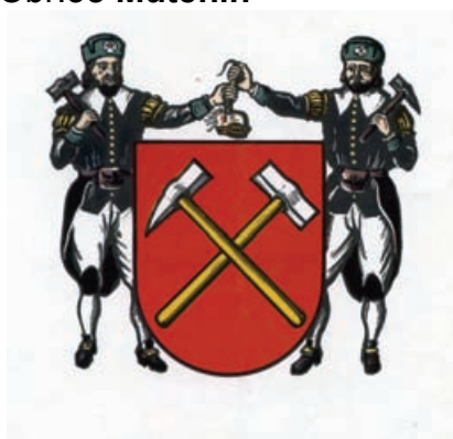
Obr.40 Loučná (Böhmische Wiesenthal)