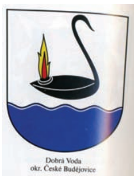
Obr.43 Dobrá Voda okr. České Budějovice