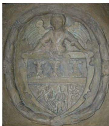
Obr.21 Andělská hora