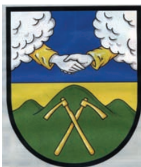
Obr.11 Loučná nad Desnou