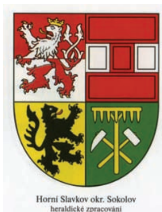
Obr.16 Horní Slavkov