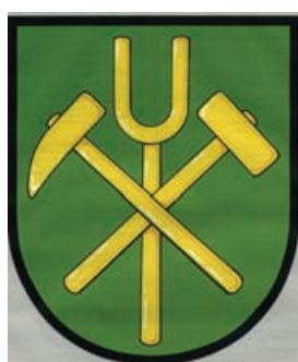
Obr.53 Hrádek u Rokycan