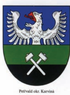
Obr.50 Petřvald okr. Karviná