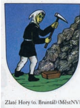
Obr.19 Zlaté Hory