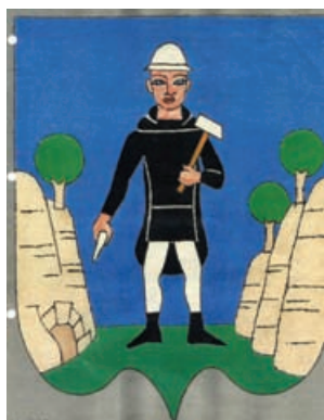
Obr.41 Bruntál – časopis Správa 1998