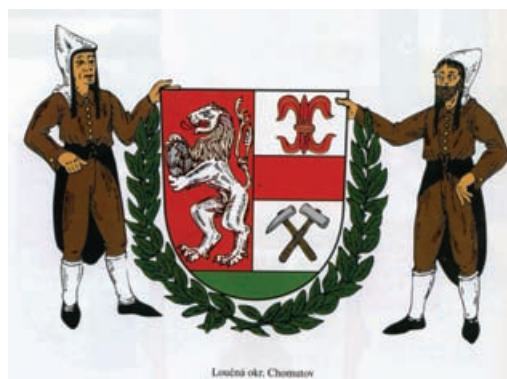
Loučná okr. Chomutov