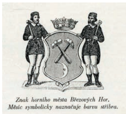
Znak horního města Březových Hor. Měsíc symbolicky naznačuje barvu stříbra.