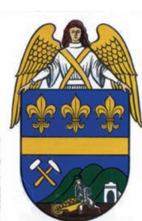
Obr.34 Andělská hora - barokní zděný portál